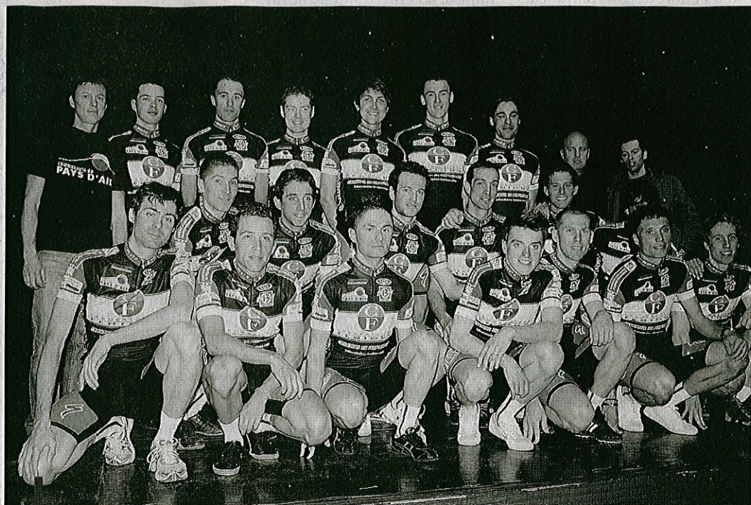
Sur piste ou sur route, les vingt coureurs de l'Amical Vélo Club Aixois constituent une équipe 2010 qui a fière allure.