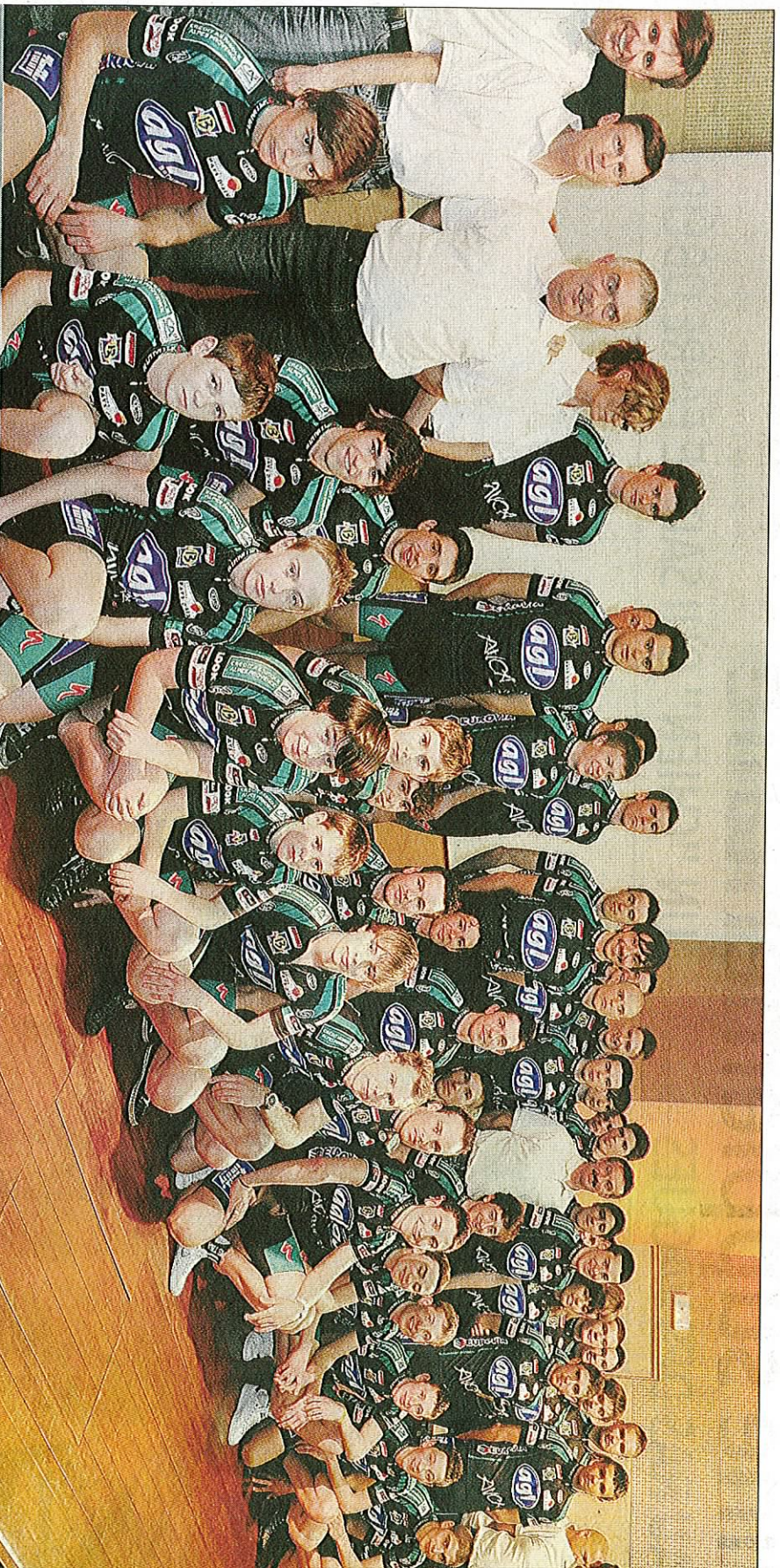
▶ La photo de famille de la saison 2009 avec les équipes du club réunies dans les locaux du Crédit agricole, un des fidèles partenaires privés.

Par Manu Gros mgros@laprovence-presse.fr